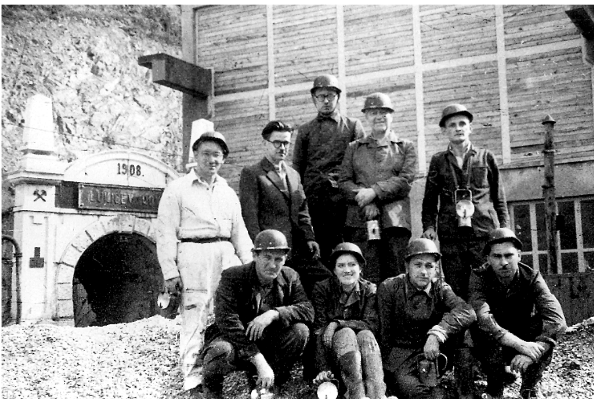
Slika 8.: Portal pred jamo na rudniku Vareš.