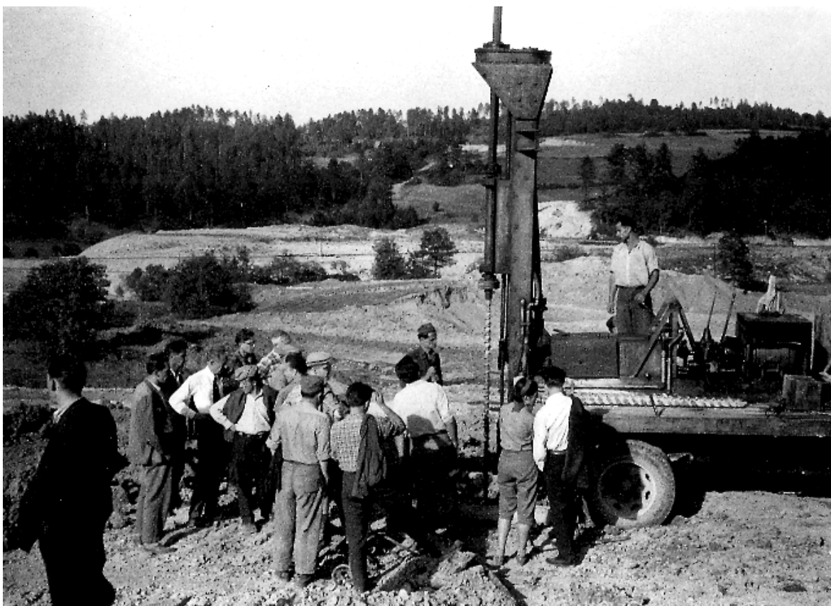
Slika 9.: Vrtanje minskih vrtin na površinskem kopu Vareš.