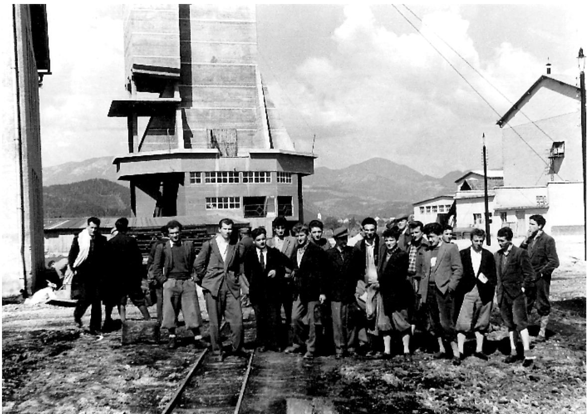
Slika 4.: Strokovna ekskurzija študentov četrtega letnika. Ogljed gradnje jaška in izvoznega stolpa v Prelogah v maju 1954.