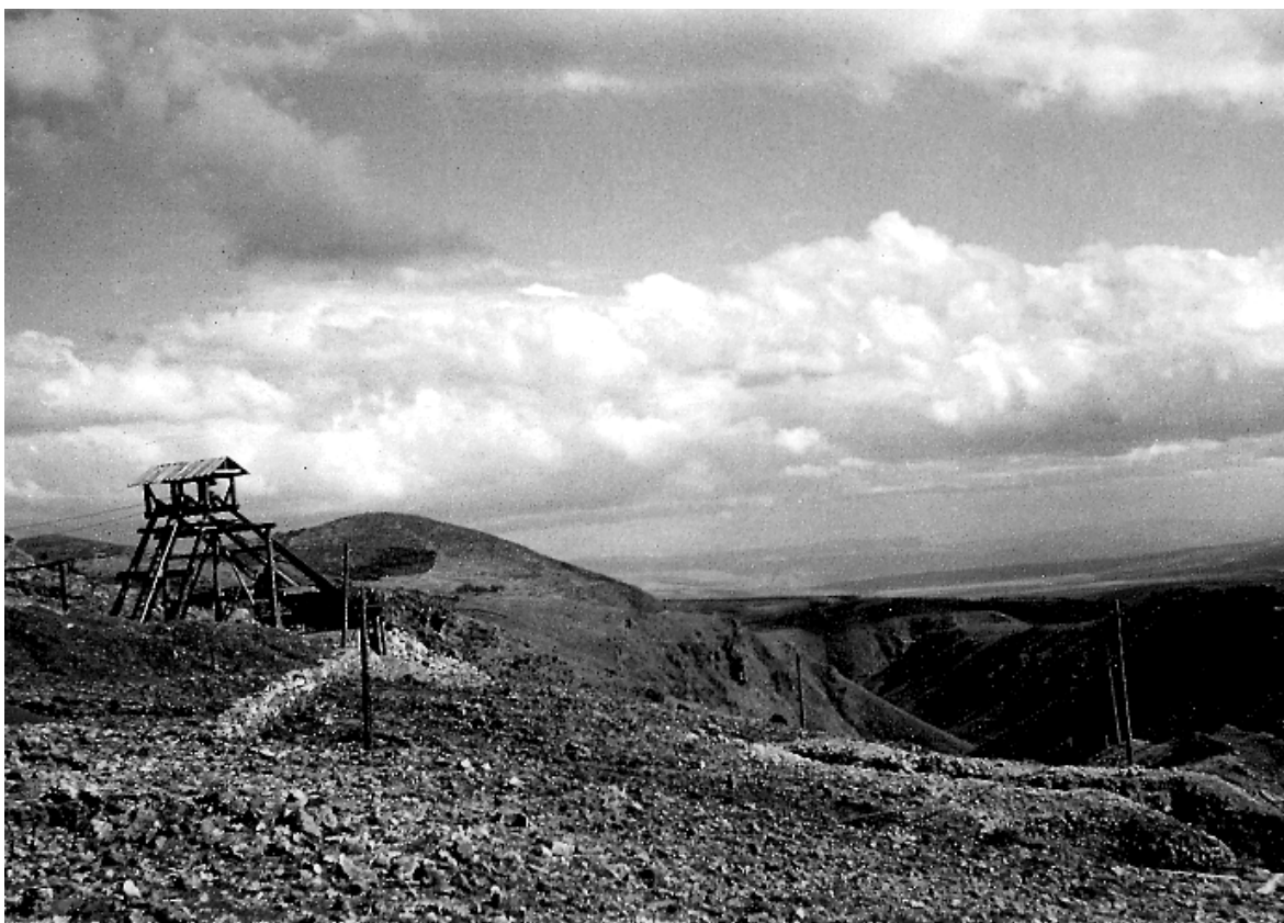
Slika 7.: Pogled na nahajališče boksita v Hercegovini.