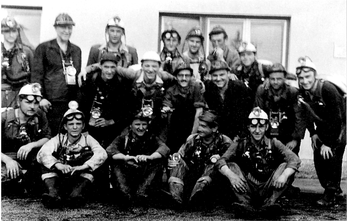
Slika 3.: Reševalna vaja študentov četrtega letnika študija rudarstva, na Rudniku lignita Velenje v maju 1954.