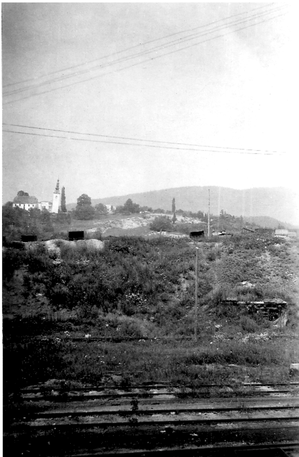
Slika 2.: Pogled s starega jaška Preloge na ugreznine v Škalah.