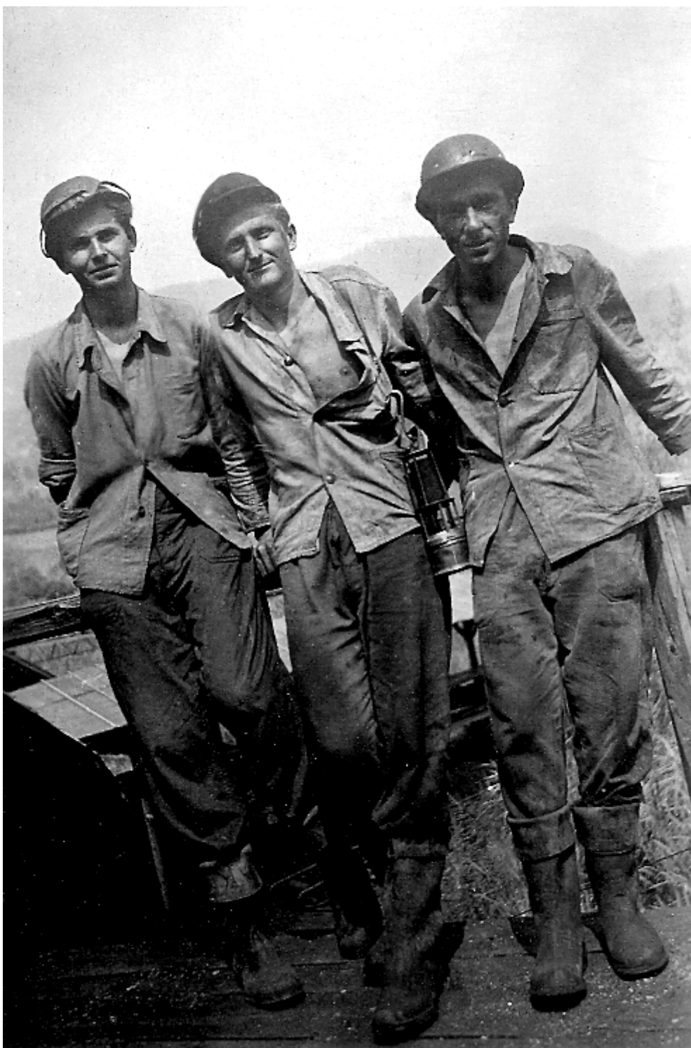
Slika 1.: Na prvi počitniški praksi v jami Škale, na Rudniku lignita Velenje, po prvem letniku študija v juliju 1951.