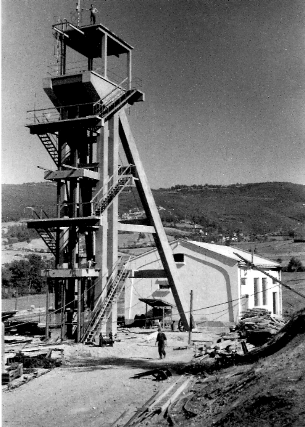
Slika 6.: Gradnja izvoznega jaška nad jamo Kamenice na rudniku Breza.

Uvod k članku objavljenem v dnevniku Delo: